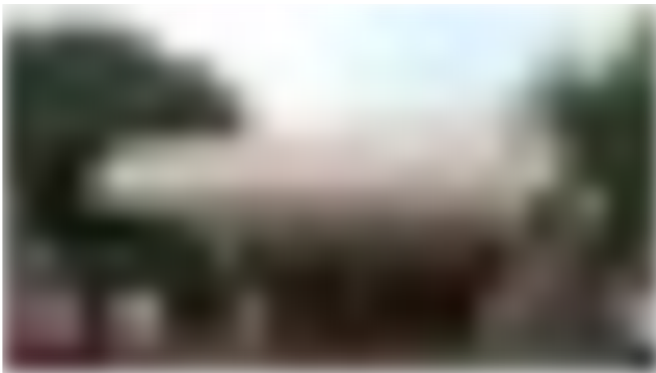
Hospital de Clínicas da Unicamp, em Campinas (SP), suspende cirurgias eletivas

As cirurgias eletivas que forem consideradas imprescindíveis serão mantidas "conforme avaliação das equipes em acordo com a coordenação de assistência", informou o HC.